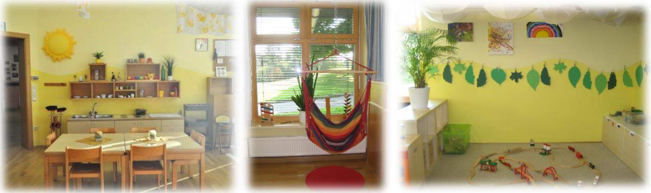
Unser Gruppenraum mit den verschiedensten Bildungsbereichen