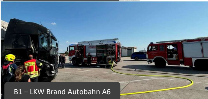
B1 – LKW Brand Autobahn A6