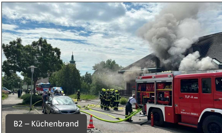
B2 – Küchenbrand

Zu den herausforderndsten Einsätzen des Jahres zählte die Alarmierung zu einem Küchenbrand am späten Vormittag des 6. Juni. Bereits der Alarmtext „Brandmelder, Auslösung vor Ort“, was das Drücken des Melders am Feuerwehrhaus bedeutet, ließ den Ernst der Lage erahnen. In nur kurzer Zeit fanden sich alle verfügbaren Kräfte unserer Wehr im Feuerwehrhaus ein, wobei bereits deutliche Brandgerüche und eine Rauchsäule unweit des Feuerwehrhauses zu erkennen waren.