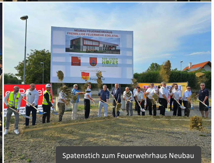
Spatenstich zum Feuerwehrhaus Neubau