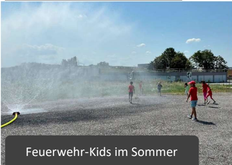
Feuerwehr-Kids im Sommer