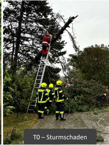
T0 – Sturmschaden