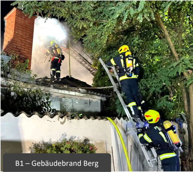
B1 – Gebäudebrand Berg