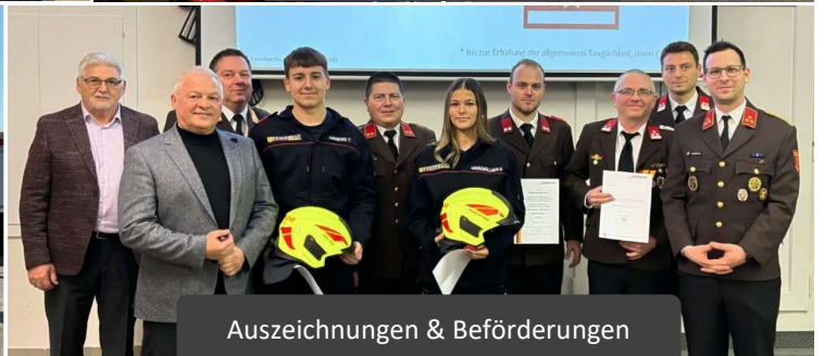
Auszeichnungen & Beförderungen