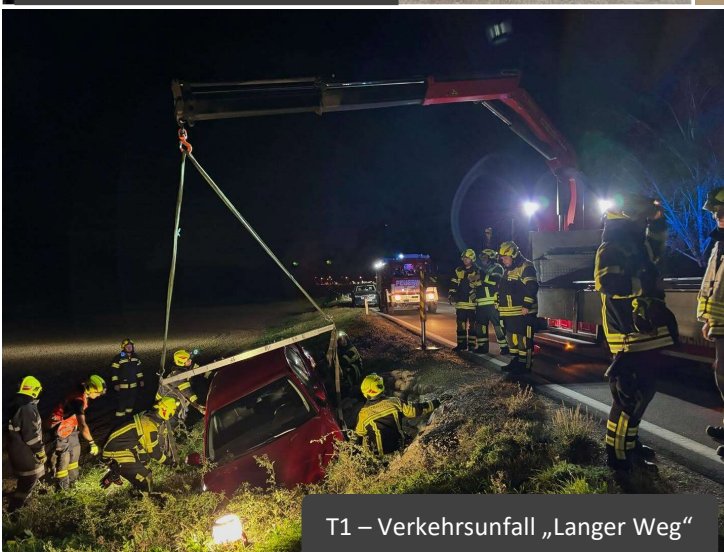
T1 – Verkehrsunfall „Langer Weg“