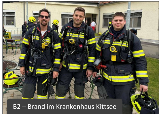
B2 – Brand im Krankenhaus Kittsee

TIPP: Fast 75 Prozent aller Brandopfer sterben nicht durch die Flammen, sondern durch den toxischen Rauch, der sich u.a. aus Kohlenmonoxid (CO, geruchlos und hochgiftig) und Kohlendioxid (CO 2 , erstickend) zusammensetzt. Rauchmelder bieten zuverlässigen Schutz und warnen akustisch vor Bränden bzw. Brandrauch und können somit Ihr Leben retten. Nur wenn ein Brand früh genug erkannt wird, besteht eine realistische Chance, das Brandobjekt rechtzeitig verlassen und auch retten zu können. Rauchmelder können im Zuge der Feuerlöscherüberprüfung am 1. März 2025 im Feuerwehrhaus erworben werden.