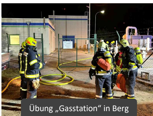
Übung „Gasstation“ in Berg