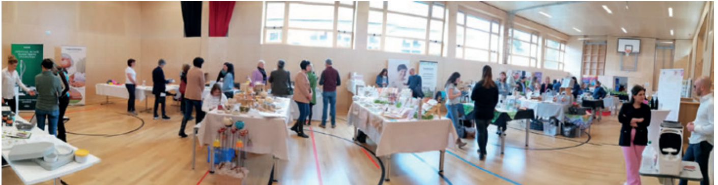
Ein bunter Ausstellermix begeisterte die zahlreichen Besucherinnen und Besucher.

der Früh mit einer Blutabnahme als Vorstufe zur Gesundenuntersuchung zu starten. Das gesunde Frühstück anschließend wurde auch von ihr gesponsert.