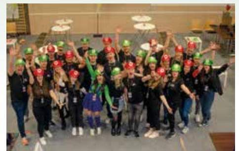
Gruppenfoto mit der FH Vereins-Crew