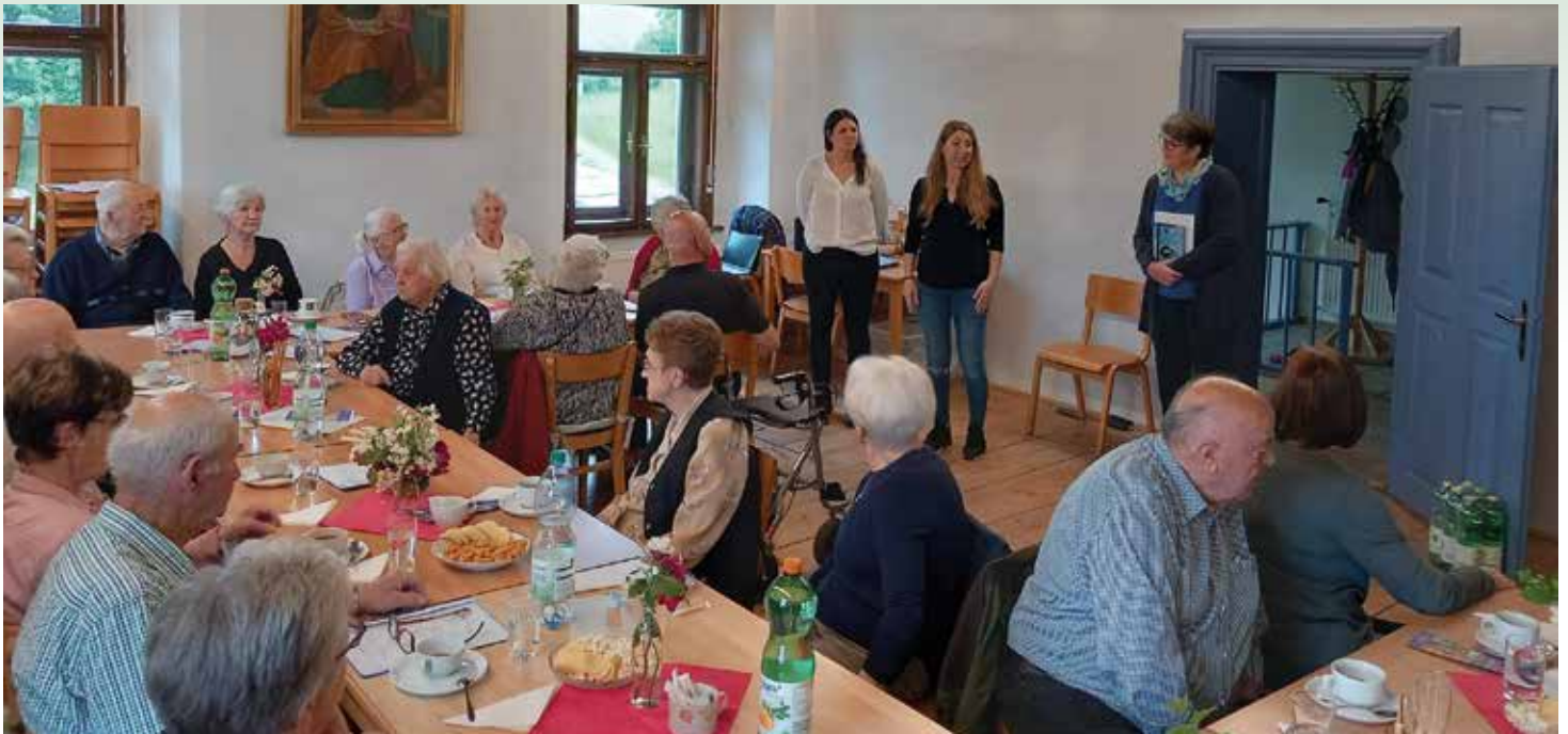
SDSW, Zam'sitzen Hengsberg Mai

Wir freuen uns sehr, dass das Community Nursing Projekt in Hengsberg von Ihnen, der Bevölkerung, begeistert angenommen wurde. Neben präventiven und Verlaufshausbesuchen bieten wir zahlreiche Gesundheitsförderungsprogramme an. Besonders beliebt ist das Zam'sitzen, das jeden dritten Dienstag im Monat im Pfarrheim Hengsberg stattfindet.