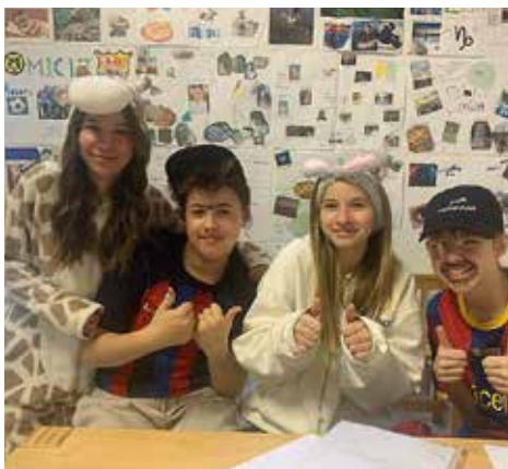
Buntes Treiben am Gang

dungen zum Thema „Pyjamaparty“ für viele schmunzelnde Gesichter gesorgt. Ein besonderer Dank gilt dem Elternverein, der für das leibliche Wohl in Form von Faschingskräften gesorgt hat sowie allen anderen, die zur Gestaltung dieses tollen Festes beigetragen haben!