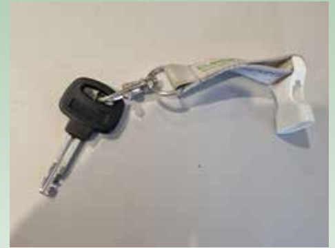
gefunden am Dorfplatz