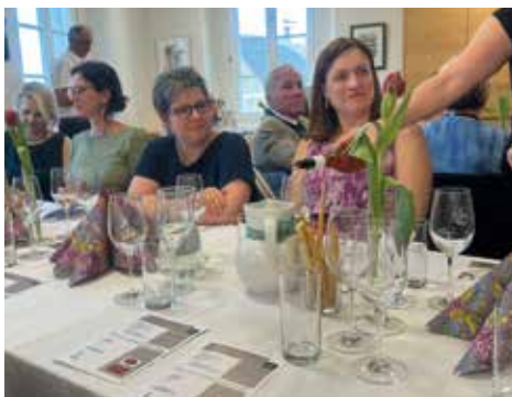
Teilnehmer an der Weinverkostung

Gleichzeitig fand auch traditionell wiederum die Bilderausstellung – dieses Mal mit Bildern der Künstlerin Eveline Fabian Kiegerl aus Deutschlandsberg – statt.