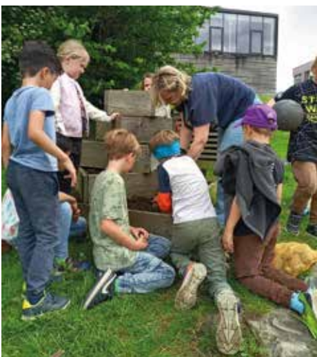
Schulgarten aktiv gestalten

und Weiterverarbeitung von Nahrungsmitteln (das Zubereiten von Kartoffelgerichten, die Kräuterverarbeitung, uvm.), da unsere Schule über einen Kräutergarten und Hochbeete verfügt. Ein DANKE den Freizeitpädagoginnen, welche bereit sind, im Freizeitteil der GTS, die heimischen Nahrungsmittel unseren Schüler*innen näher zu bringen und eine Erdverbundenheit erfahrbar zu machen. Denn ein bewusster Umgang mit Lebensmitteln ist uns ein großes Anliegen.