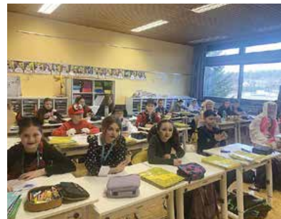
Welche Klasse hat sich hier wohl maskiert?