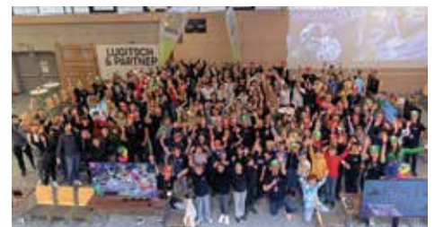
Gruppenfoto mit allen Teilnehmer*innen