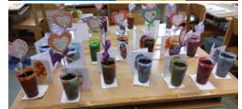
Kreativwerkstätte für Muttertag