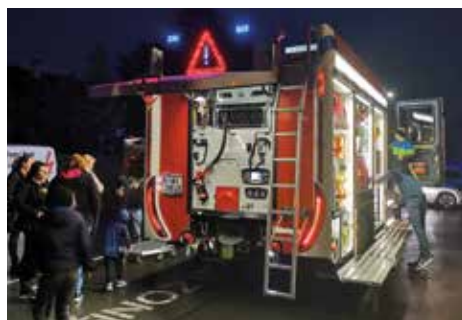
Begeisterte Besucher beim Empfang