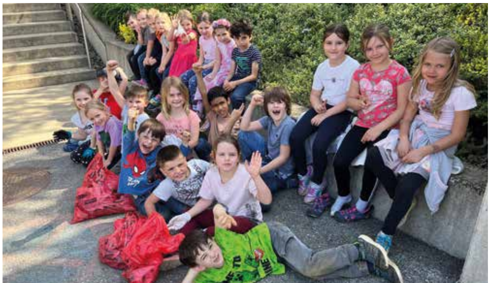
Frühjahrsputz in der Gemeinde Hengsb erg

Das ist ein unschätzbare Beitrag für eine saubere Steiermark.