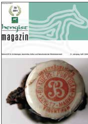
Das aktuelle Hengist-Magazin bietet wieder eine bunte Palette an Beiträgen zu Biologie, Archäologie und Geschichte unserer Region.

Weitere Informationen zu allen Veranstaltungen und zum Verein „Kulturpark Hengist“ finden Sie unter www.hengist.at