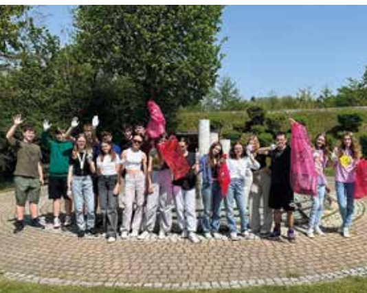
Schüler*innen der MS Lebring beim Frühjahrsputz

Auch heuer beteiligten sich die Schüler*innen der MS Lebring mit großem Einsatz beim Frühjahrsputz. Am Freitag, 12.04.2024, wurde die letzte Unterrichtsstunde dafür genutzt, aktiv mitzuhelfen. Den Jugendlichen machte es bei großartigem Wetter sichtlich Spaß!