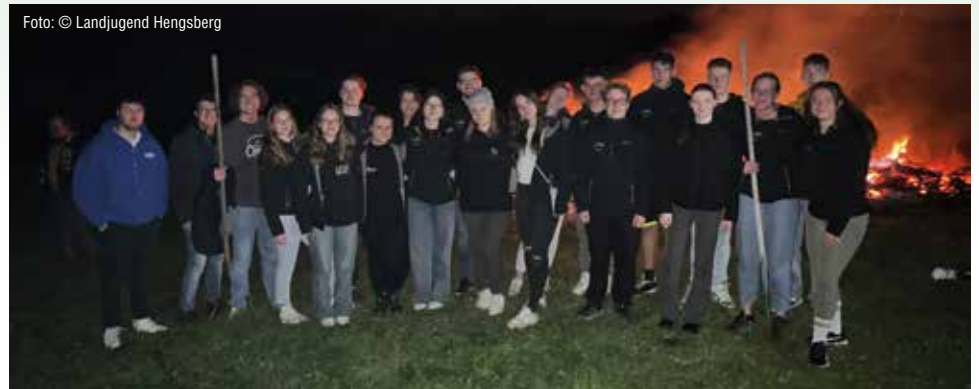
Die helfenden Mitglieder

Vielen Dank an alle, die uns Holz gespendet haben und an die FF Hengstberg, die für unsere Sicherheit gesorgt hat.