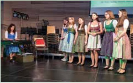
Ein Dankeschön an die jungen Damen der Gruppe Keppltoschn für die Gesangseinlage