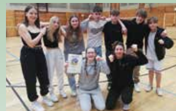
Dritter Platz für das Team 1 der Mittelschule