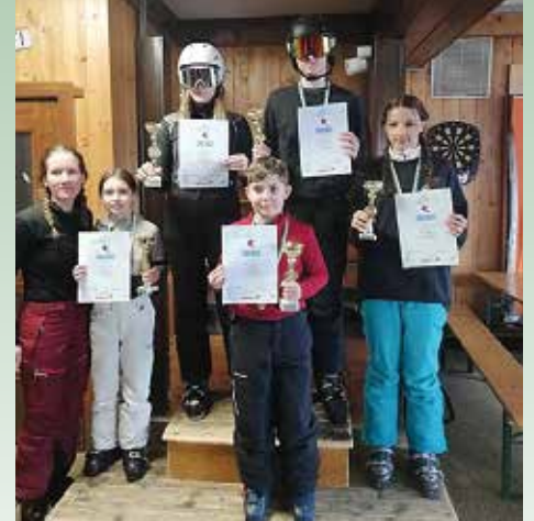
Viele Pokale gab es für die großartigen Leistungen der Schüler*innen.

(2. Platz, Jahrgang 2012/2013) erkämpften sich jeweils einen Pokal. Betreuer*innen: Lena Gollowitsch, Matthias Stifter