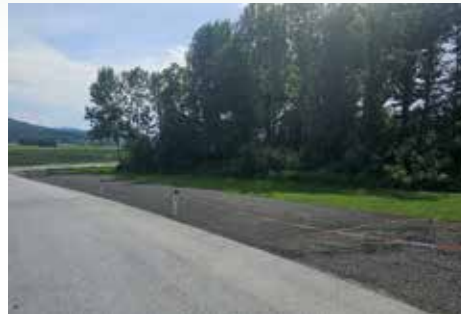
Parkplatz Neu vor dem Rüsthaus in Schönberg

Im Zuge der Neu-Asphaltierung der L602 wurde auch unser „neuer“ Parkplatz gegenüber dem Rüsthaus Schönberg mit einer Asphalttschicht versehen und gilt somit als fertiggestellt. Danke an die Gemeinde und allen Beteiligten für die Umsetzung!