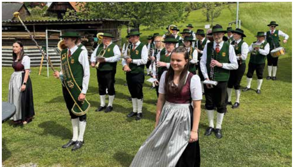
Musikalische Umrahmung der Feierlichkeiten in Kehlsdorf