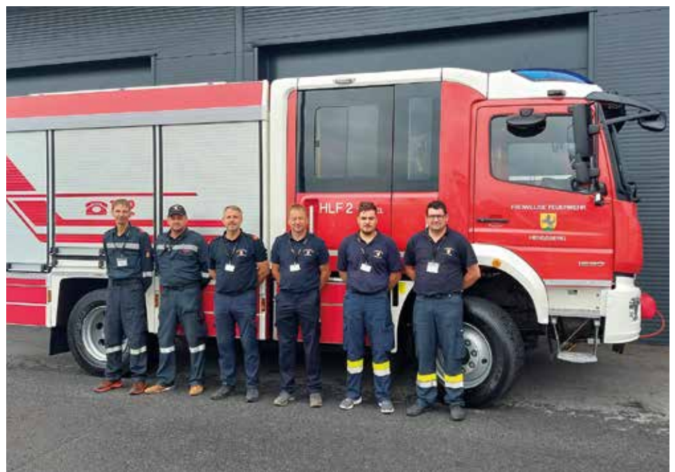
Übergabe beim Hersteller