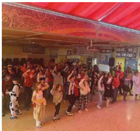
Gemeinsame Disco in der Aula