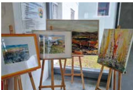
Bilderausstellung der Künstlerin

Gleichzeitig fand auch traditionell wiederum die Bilderausstellung – dieses Mal mit Bildern der Künstlerin Eveline Fabian Kiegerl aus Deutschlandsberg – statt.