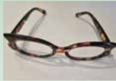
gefunden beim Eingang zur Kinderkrippe

Sollten Sie Gegenstände vermissen oder gefunden haben, melden Sie sich im Gemeindeamt!