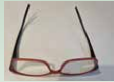
gefunden beim Friedhof