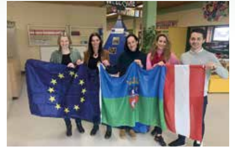
Austausch, Vernetzung und Internationalität an der Mittelschule

Freigegegenstände „Robotik“ und „Digitales Experimentieren“, die besonders auf technikinteressierte Schüler*innen abzielen. Die Woche war geprägt von gegenseitiger Wertschätzung, viel Engagement und neuen Einblicken, welche der Schulqualität beider Schulen zugutekommen werden. Darum verwundert es auch nicht, dass bereits Gespräche über zukünftige Kooperationen geführt wurden.