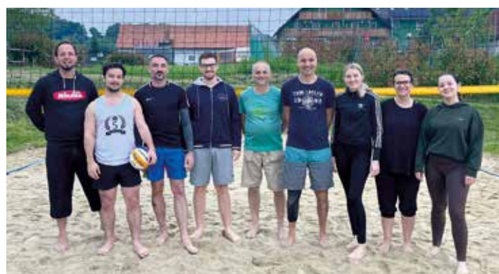
Die fleißigen Mitglieder

Das Warten hat ein Ende! Am Ende der Hallensaison freuen sich alle aufs Beachen. Der Beachplatz wurde hergerichtet. Alle Spieler sind motiviert und freuen sich auf die warmen Tage und den