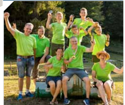
Es gab 2024 viele Erfolge zu feiern!