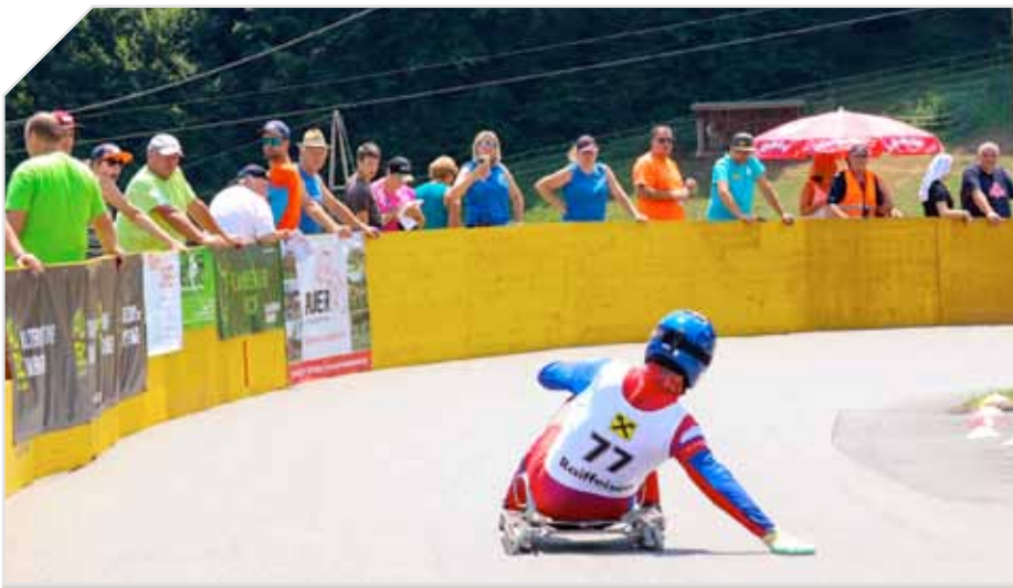
Spektakuläre Rollenrodel-Rennen in der Südsteiermark.