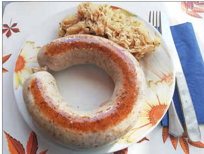
Kartoffelwurst mit Sauerkraut

Anmeldungen für das Essen werden bis zum 17. Oktober entgegengenommen.