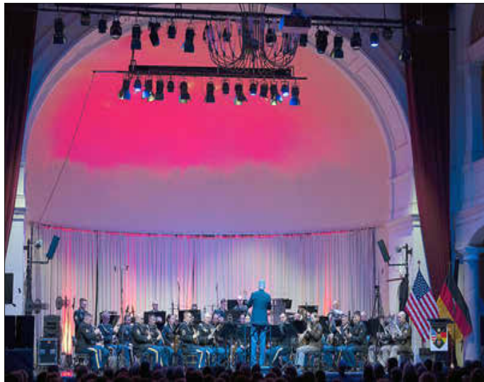
U.S. Army Garrison Rheinland-Pfalz

Der Eintritt zu diesem Konzert ist kostenlos. Kartenvergabe erfolgt im Voraus in den Räumen des deutsch-amerikanischen Bürgerbüros im Rathaus Nord, Erdgeschoß, Eingang Lauterstraße 2 in Kaiserslautern, am Donnerstag, 26. September 2024, von 16 bis 18 Uhr. Telefonische Vorbestellungen sind nicht möglich; es werden pro Person je 2 Karten vergeben.