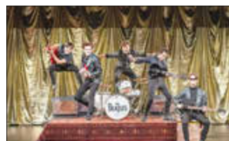
Am 17. August 1960 begann im „Indra“ die Karriere der Beatles in Hamburg.

Ende Oktober startet das Theaterprogramm der Stadt Idar-Oberstein für die Spielzeit 2024/2025. Das Kulturamt präsentiert im Stadttheater Idar-Oberstein sechs abwechslungsreiche Veranstaltungen und verspricht den Theaterbesuchern beste Unterhaltung, brillantes Theater und rockige Musik. Unterstützt wird das Theaterprogramm von der Kreissparkasse Birkenfeld als Hauptsponsor. Der Kartenvorverkauf hat begonnen.