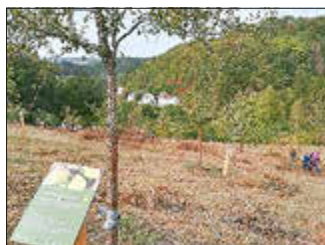
Obstbaumanpflanzung und Revitalisierung in Dhronicken

Jetzt Förderanträge für das Jahr 2025 stellen