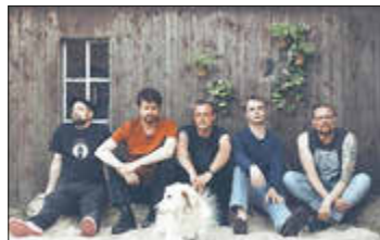
Die Band NO°RD mit ihrem außergewöhnlichen Sound ist der Headliner der Veranstaltung.

NO°RD ist mittlerweile eine feste Größe in der Deutschpunk-Szene. Die Band vereint Einflüsse von Turbostaat, Pascow und Duesenjäger und liefert mit ihrem aktuellen Album „Böse Wetter“ eine eindringliche Mischung aus Emotionalität und Melancholie. Die klar antifaschistische, antirassistische und antisexistische Haltung der Band macht sie zu einer wichtigen Stimme unserer Zeit.