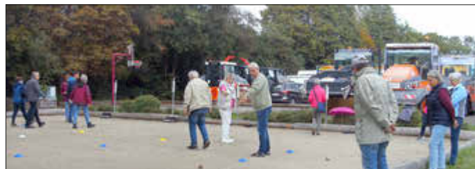
Das Interesse an dem Boule-Schnuppernachmittag war groß.

Seitens der Landesinitiative „Rheinland-Pfalz in Bewegung“ fand kürzlich in Kooperation mit dem Seniorenbüro der Stadt Idar-Oberstein ein kostenloser Boule-Schnuppernachmittag für Neulinge in Nahbollenbach statt. An der von der „Offenen Gruppe“ gepflegten Bouleanlage am Festplatz fanden sich 17 Personen ein. Klaus Juchem stellte die Landesinitiative, deren Hauptziel es ist, Menschen zu mehr Bewegung zu motivieren, sowie das französische Kugelspiel vor. In den folgenden drei Spielen mit jeweils neu ausgelosten Teams hatten alle viel Spaß und die Kommunikation kam auch nicht zu kurz.