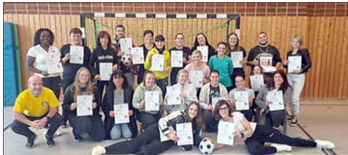
Die Teilnehmer hatten viel Spaß bei der Fortbildung und können die Freude an der Bewegung an die Kinder weitergeben.

Sie funktionieren mit verschiedenen Gruppengrößen, in kleinen Bewegungsräumen oder auf dem Außengelände. Vom „Zwergenland“ und „Über die Wolken“ bis hin zu „Auf eine Insel“ – die Kinder tauchen immer wieder in neue Welten ein und entwickeln dabei mehr oder weniger unbewusst Spaß an der Bewegung. Bälle kommen in unterschiedlichsten Formen und Variationen zum Einsatz und verstärken durch ihren hohen Aufforderungscharakter die Freude an der Bewegung. Alle Teilnehmer erhielten eine Broschüre sowie einen Softball – jede Kita ein kleines „Starter-Set“ mit Equipment zur Durchführung der Spielstunden.