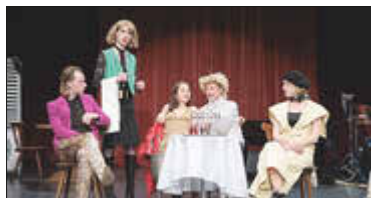
Das Neue Globe Theater inszeniert ‚Mephisto‘ revuehaft mit Livemusik und Conférencier.

Theaterprogramm wird mit ‚Mephisto‘ fortgesetzt