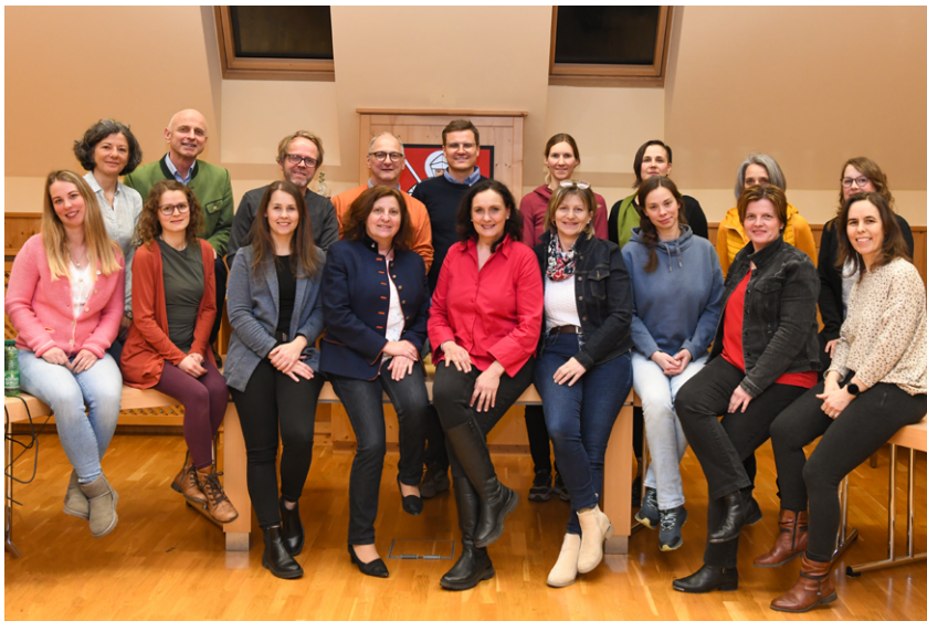
→ Das Netzwerk „Gemeinsam g'sund“ bündelt zahlreiche Angebote in unserer Gemeinde.

Verein „Geben für Leben“ – Leukämiehilfe Österreich Spendenkonto: AT39 2060 7001 0006 4898