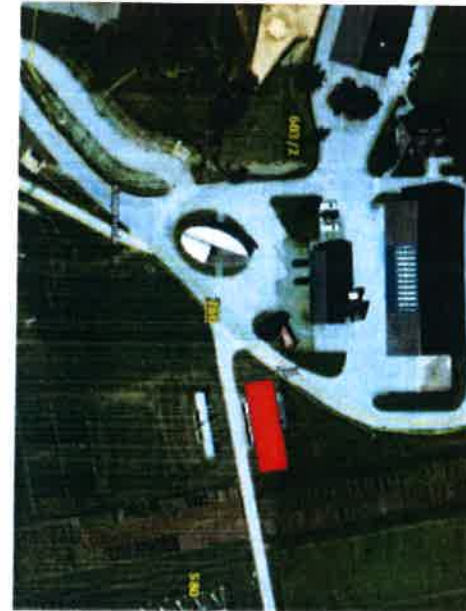
ACHTUNG DARSTELLUNG OHNE MAßSTAB!!!!